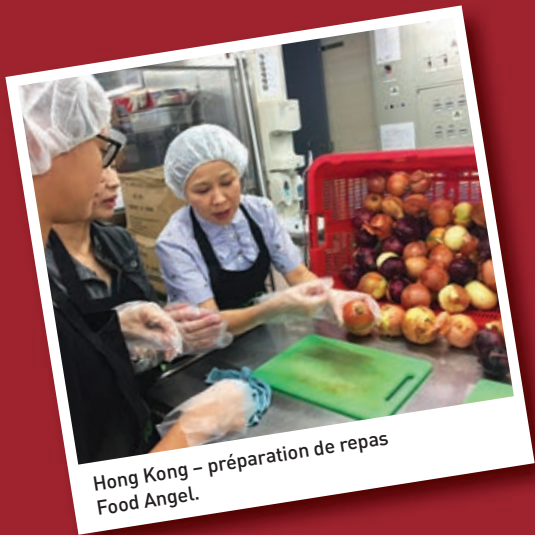
Hong Kong – préparation de repas Food Angel.

En Chine, Supor soutient l'éducation des plus défavorisés, dans toutes les provinces.