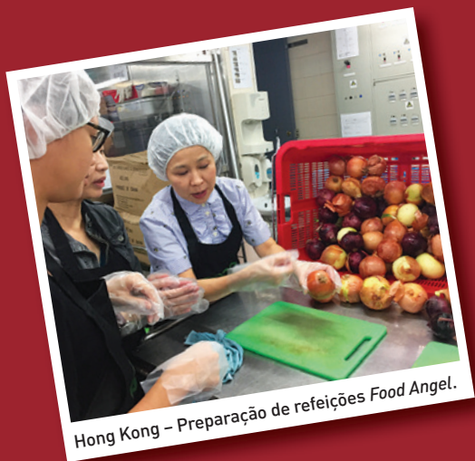
Hong Kong – Preparação de refeições Food Angel.

Na China, a Supor apoia a educação dos menos favorecidos, em todas as províncias.