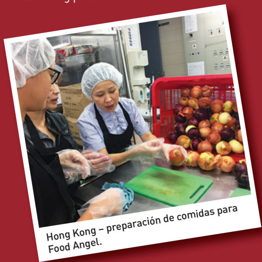
Hong Kong – preparación de comidas para Food Angel.

En China, Supor apoya la educación de los más desfavorecidos en todas las provincias.